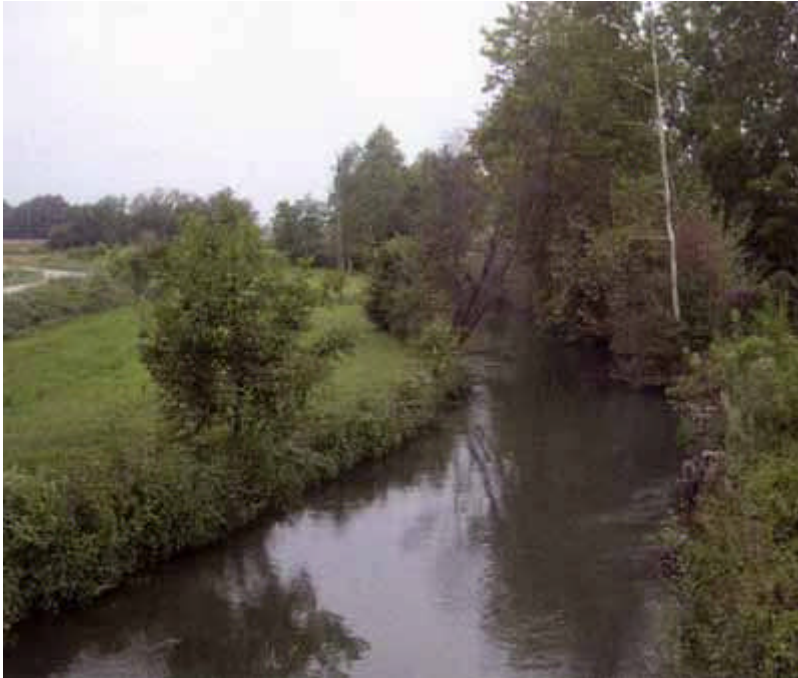
colatore Muzza a S. Martino in Strada

☎ 0371 432700 📠 0371 30499 @ apssl@fipsaslodi.it