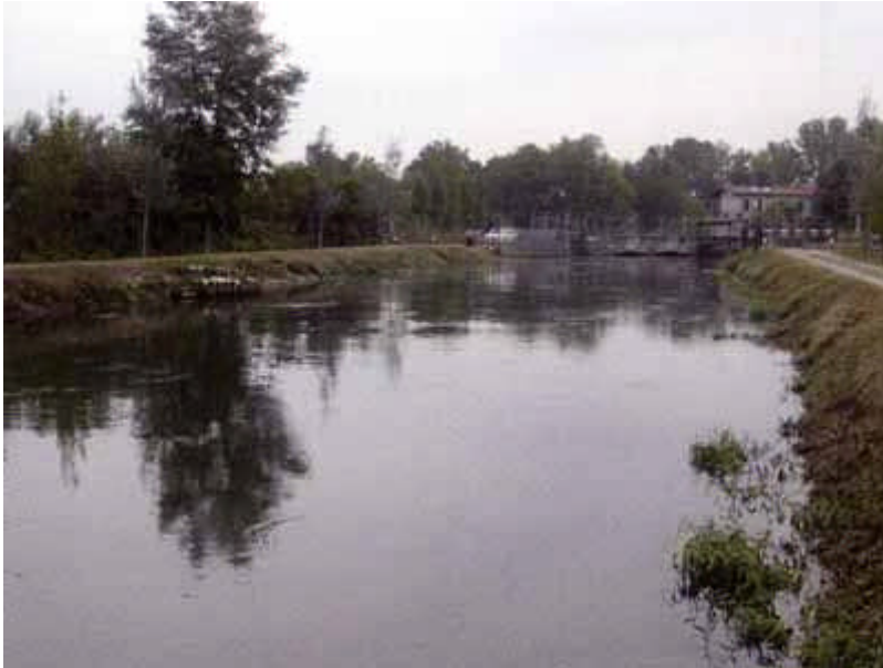
canale Muzza a Tripoli