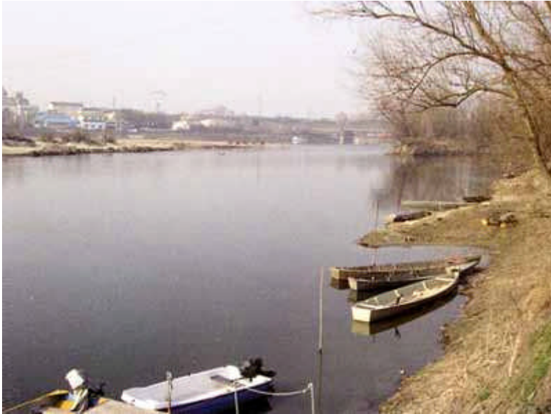
fiume Po a San Rocco al Porto

☎ 0371 432700 📠 0371 30499 @ apssl@fipsaslodi.it