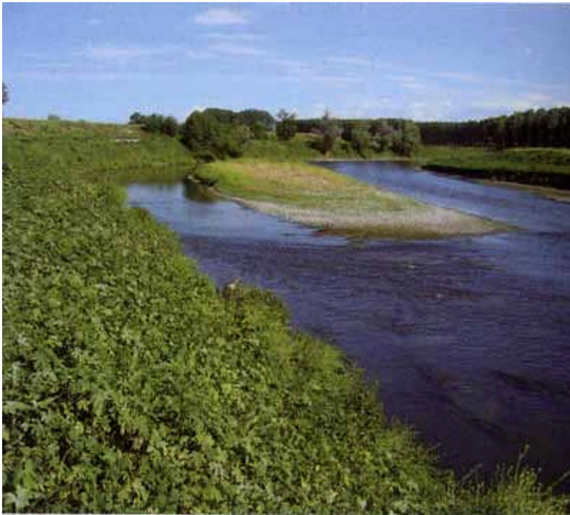
fiume Lambro a Orio Litta

La fauna ittica del Lambro risente notevolmente sia dell'elevato inquinamento delle acque sia della diffusione di specie esotiche, che risultano predominanti e costituite principalmente da siluro, barbo d'oltralpe, aspice e lucioperca. Nei tratti superiori la specie principale risulta il carassio. Tra le specie di piccole dimensioni è sorprendentemente diffuso lo spinarello.