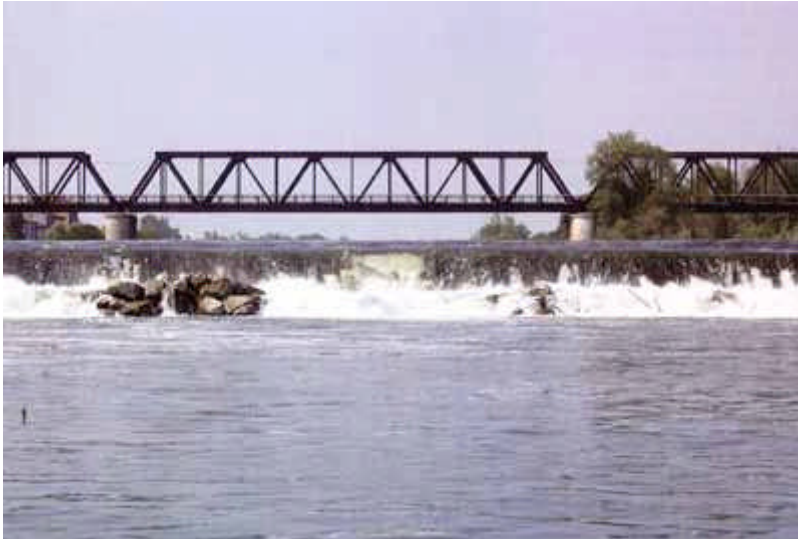
fiume Adda nei pressi dello sbarramento di Maleo

☎ 0371 432700 📠 0371 30499 @ apssl@fipsaslodi.it