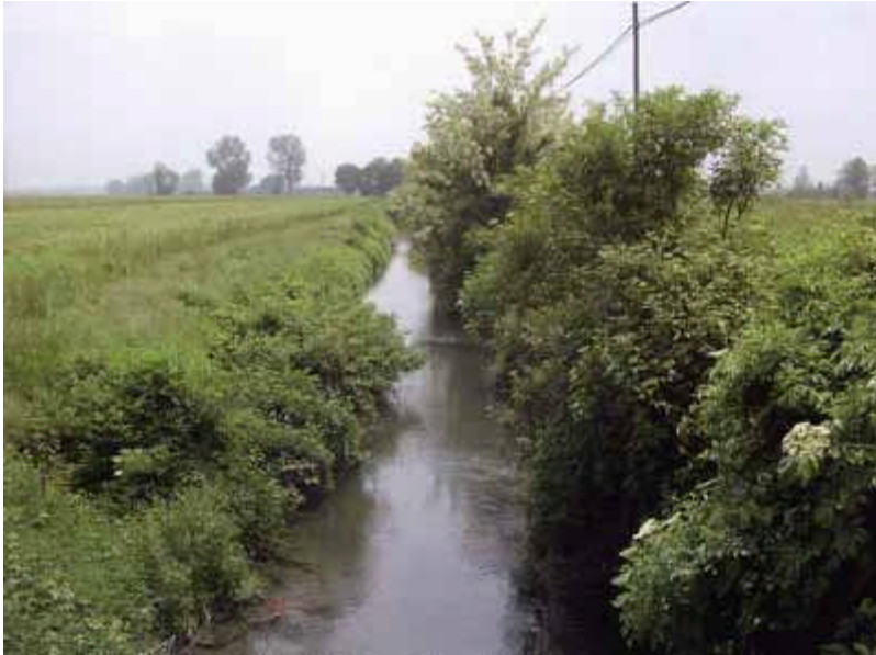
particolare della roggia Codogna nei pressi di Lavagna