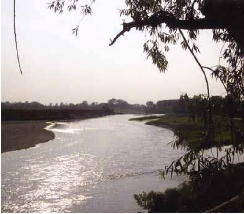
fiume Adda a valle di Bertonico

☎ 0371 432700 📠 0371 30499 @ apssl@fipsaslodi.it