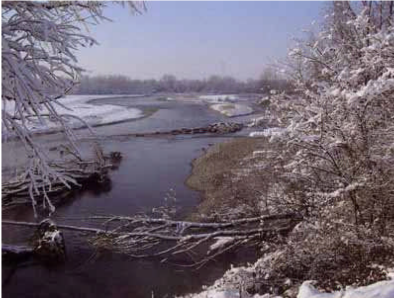
fiume Adda in comune di Boffalora

☎ 0371 432700 📠 0371 30499 @ apssl@fipsaslodi.it