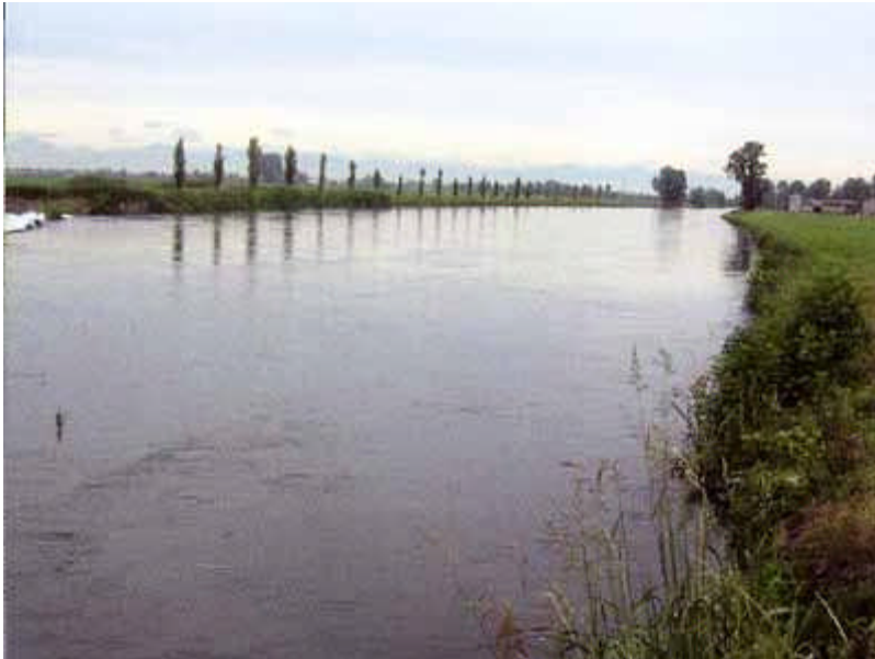
canale Muzza a Lavagna

La fauna ittica risulta costituita in prevalenza da ciprinidi reofili quali cavedano, barbo comune e vairone. Ben rappresentati sono anche il ghiozzo padano e il cobite comune. I salmonidi sono limitati al tratto superiore. Tra gli esotici, sono molto diffuse le carpe, anche di grosse dimensioni e sono in espansione il siluro, il rodeo amaro e la pseudorasbora.