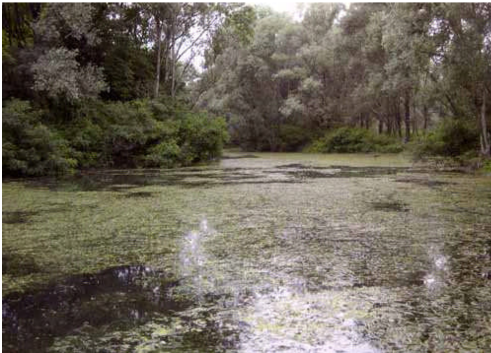
lanca ricca di vegetazione acquatica

La comunità ittica delle lanche o delle morte può essere variabile a seconda della trasparenza dell'acqua e della presenza di fenomeni di risorgenza. In lanche alimentate da acqua di falda e con buona trasparenza si assiste alla presenza massiccia di piante acquatiche, che consentono la riproduzione a specie ittiche relativamente esigenti come il luccio. Viceversa in ambienti stagnanti privi di fenomeni di risorgenza e con acque ricche di nutrienti predominano le fioriture algali che rendono l'acqua torbida. In questi casi vengono favorite alcune specie alloctone quali la pseudorasbora, il rodeo amaro, il persico sole e il persico trota. In talune lanche del lodigiano si riscontra la quasi totale assenza di specie autoctone.