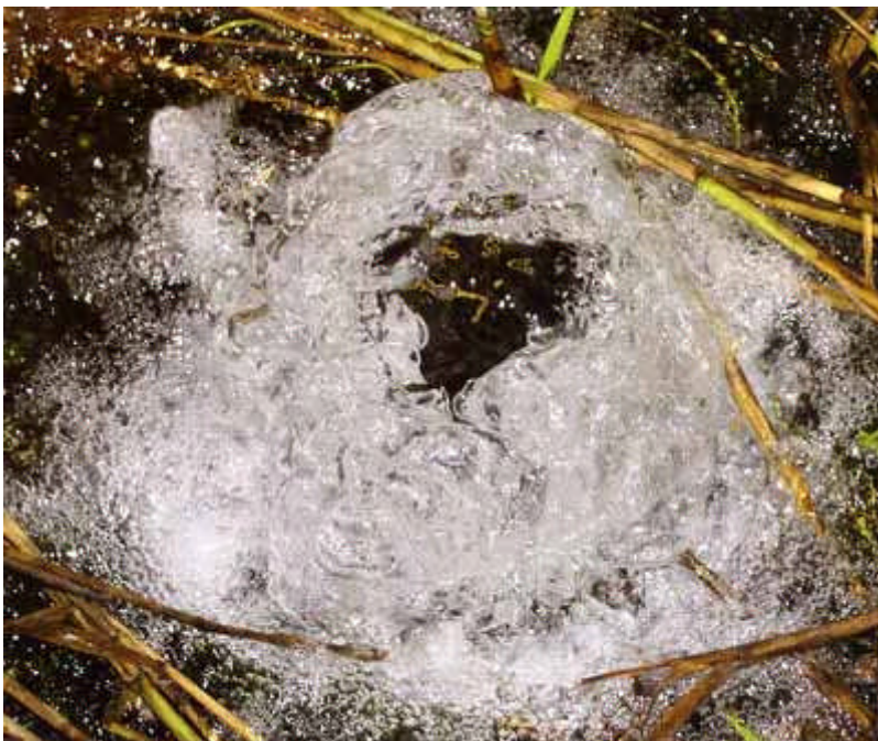
un occhio di fonte

sono quelle legate alla manutenzione della vegetazione acquatica, che se effettuata con mezzi meccanici può danneggiare direttamente l'ittiofauna. Da collegare alle esigenze di manutenzione sono le asciutte periodiche di alcuni corsi, che determinano grave danno alle comunità ittiche. La comunità ittica dei fontanili annovera specie di particolare interesse naturalistico. Le più diffuse e abbondanti risultano in genere il ghiozzo padano e il vairone. Ben rappresentati sono anche cavedano, gobione e in molti casi sanguinerola. Relativamente al luccio, i fontanili costituiscono ad oggi una delle poche aree con discreta presenza di esocidi. Nei tratti con acqua più lenta e limacciosa si rinvencono il triotto, la scardola, il cobite mascherato e il panzarolo, mentre in alcuni corsi a fondo sabbioso si può osservare la lampreda padana. Nei tratti terminali dei fontanili, in prossimità del fiume Adda, è possibile rilevare in alcuni periodi dell'anno la presenza della trota marmorata.